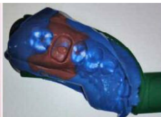
図2 撤去した印象体